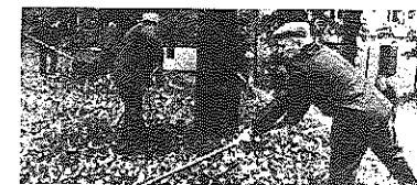
Detenuti al lavoro nel parco Cittadella.

Ci sono rimasti davvero male quando, una mattina di qualche settimana fa, si sono accorti che i bulbi messi a dimora nelle aiuole appena zappate, erano spariti: qualcuno li aveva rubati durante la notte. «Proprio a me doveva capitare?», ha esclamato un detenuto, in San Francesco per una lunga serie di furti nei quartieri «In» di Milano. Nonostante questo incidente di percorso, l'11 giugno verrà inaugurata la «Cittadella restaurata». Un primo restyling ecologico («Si va a stralci, c'è molto ancora da fare da investire», ha detto l'assessore Breno Beganj) ad opera di detenuti che hanno «investito» i rispettivi giorni di permesso per ripulire il parco della Cittadella, allestire un percorso per il footing e per collocare attrezzi ginnici sui prati dei bastioni. L'11 giugno, in occasione di una vera e propria kermesse che culminerà con un «salot-