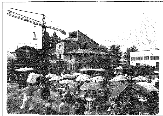
La Festa al "Castello" nella primavera del '92. Sullo sfondo il cantiere del "Castello".

Viene attivato un servizio gratuito di infermeria per il quartiere Parma-Centro, mediante l'impiego di una detenuta infermiera. Questo servizio è messo a disposizione di una zona della città, con particolare attenzione agli utenti più anziani, per offrire tutti quei piccoli interventi e consigli sanitari che spesso l'attuale organizzazione sanitaria si trova impossibilitata a fornire.